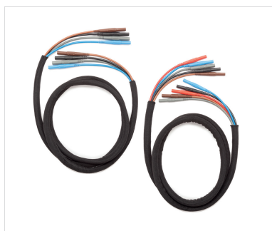
Рис.: Отводы для измерения напряжения