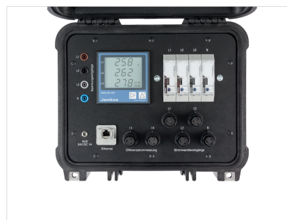
Рис.: MRG 96RM-E RCM Flex - Портативный прибор для измерения энергии с измерением дифференциального тока-RCM (Аналогичное изображение)