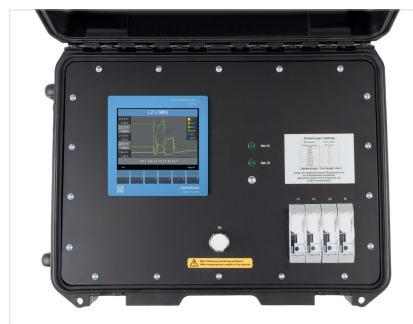
Рис.: MRG 512-PRO PQ Flex – Портативный анализатор качества электроэнергии с измерением дифференциального тока-RCM (Аналогичное изображение)