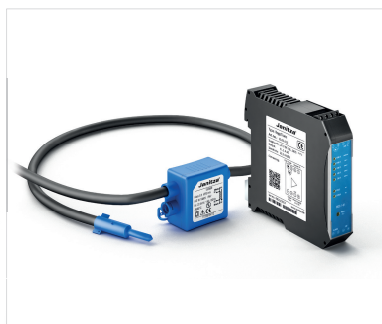
Рис.: Пояс Роговского с измерительным преобразователем