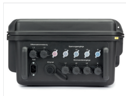
Рис.: Разъемы для подключения трансформатора тока и напряжения; вспомогательное напряжение и подключение к Ethernet